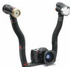
Maxx Duo con torcia, flash, 2 bracci flessibili e ripiano doppio