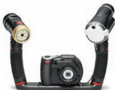
Pro Duo con torcia, flash e ripiano doppio