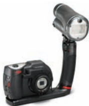
Pro Set con flash singolo

Per ottenere foto subacquee ancora più luminose e piene di colori, il sistema della fotocamera Sea Dragon prevede una serie di espansioni. I sistemi modulari di bracci Flex-Connect, impugnature e ripiani si agganciano tra loro con semplicità per creare svariate configurazioni, tra cui quelle più comuni sono: