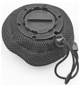
Lens inside lens pouch