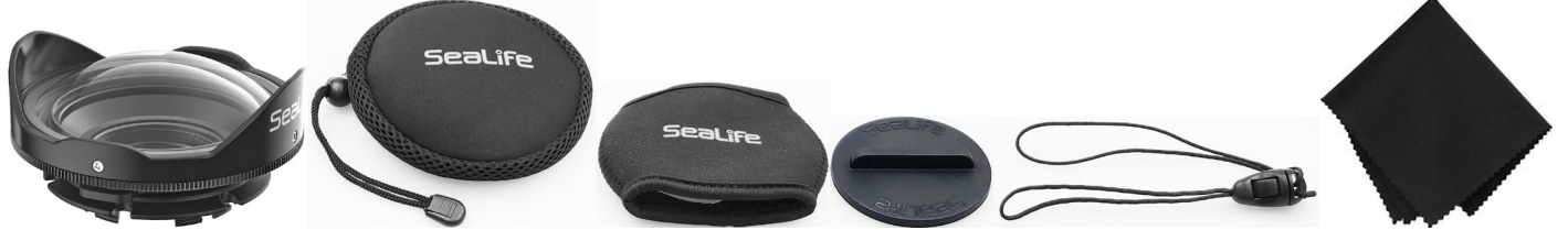
Wide Angle Dome Lens (with Lens Adapter attached)