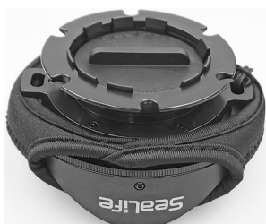
Lens with dome and rear lens covers attached