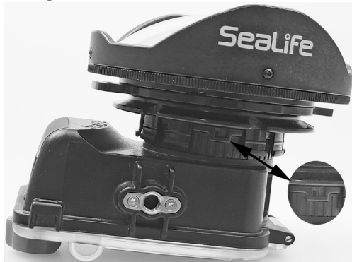
Follow instruction in step 3a making sure that the camera Lens port slot is located between the lens adapter fingers