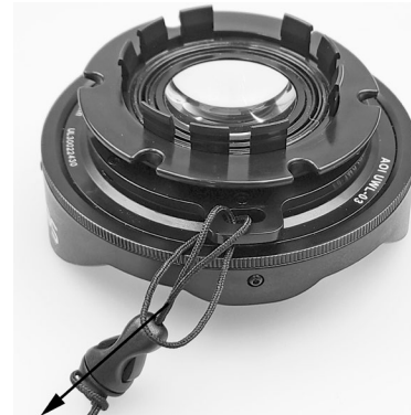
Feed the other end of lanyard through looped end and tighten. Attach other end of lanyard to the camera's lanyard hole. The lanyard can be separated by pushing the release lever on the center connector