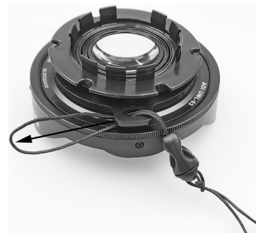
Insert looped end of lanyard through hole on side of the lens adapter