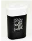
Batterie Li-ion (SL9831) avec couvercle de protection