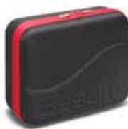
Mallette Sea Dragon (article SL942) (Mallette NON incluse avec la lampe 2000F et 2300F)