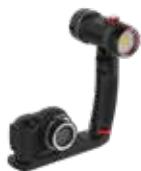
Micro 3.0 Pro 3000 avec lampe

Obtenez des résultats plus brillants, plus colorés en étendant le système de votre appareil photo sous-marin. Les bras, poignées et plateaux modulaires Flex-Connect s'assemblent facilement les uns aux autres pour créer ces configurations. Les ensembles d'appareil photo suivants sont disponibles complets, appareil photo et éclairage.