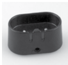
Plateau de chargement (SL98311)