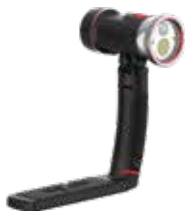
Sea Dragon 3000SF Pro Dual Beam (SL679)