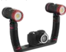
Micro 3.0 Pro 5000 avec 2 lampes