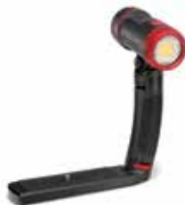
Sea Dragon 2500F (SL671)