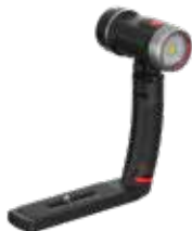
Sea Dragon 2300F (SL682)

Lampes Sea Dragon illustrées avec Grip and Tray, des têtes de la lampe sont également disponibles séparément sans Grip and Tray.