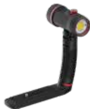
Sea Dragon 3000F Color Boost (SL681)

Lampes Sea Dragon illustrées avec Grip and Tray, des têtes de la lampe sont également disponibles séparément sans Grip and Tray.