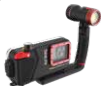
SportDiver Ultra Pro 2500 avec lampe