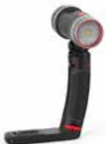
Sea Dragon 2000F Light (SL677)