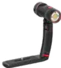
Sea Dragon 3000F Auto Light (SL678)